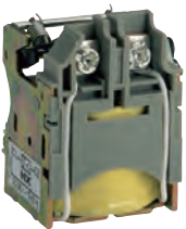
Расцепитель MN или MX