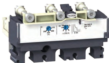
Расцепитель Micrologic TM-D