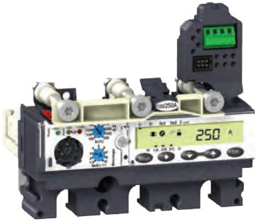
Расцепитель Micrologic 5 E