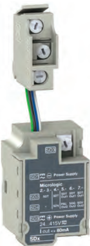
Релейный модуль SDx дистанционной сигнализации с клемником