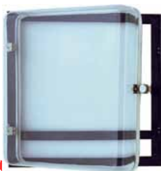
Прозрачный кожух (CCP) для рамки передней панели